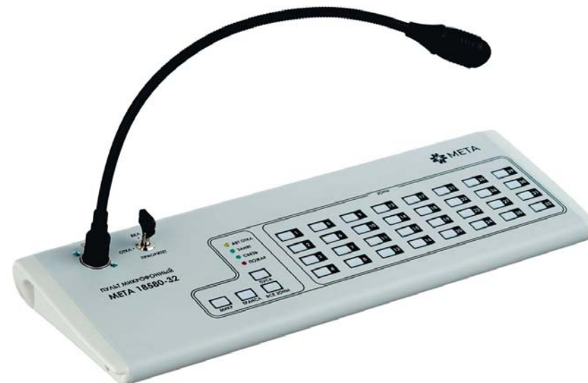
Рисунок 1. Внешний вид МП МЕТА 18580-32.