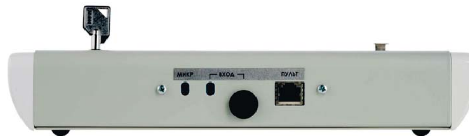
Рисунок 2. Внешний вид задней панели МП.