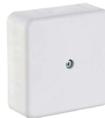
Рисунок 1. Внешний вид ОКК.