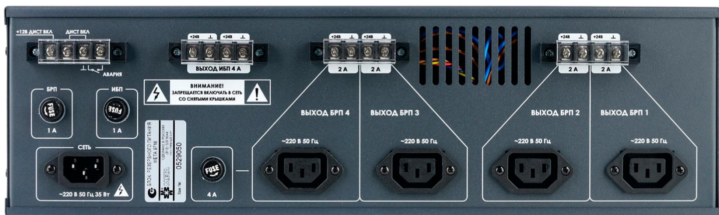
Рисунок 3. Элементы коммутации (клеммы и разъемы) БРП МЕТА 9716.