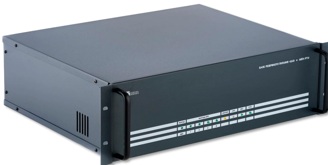
Рисунок 1. Внешний вид БРП МЕТА 9716.