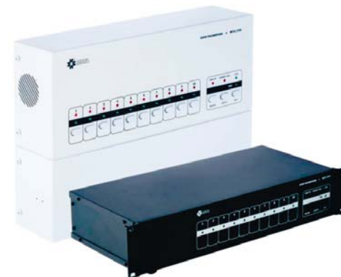
Рисунок. Внешний вид БР МЕТА 17556/19556.